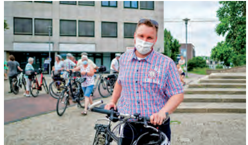
Nah an den Menschen: Stadtradeln der CDU Garbsen