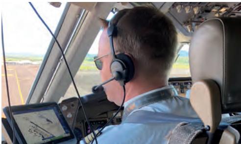
Am Arbeitsplatz: Hohe Verantwortung für Mensch und Technik