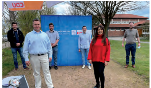
In der Politik: Teamfähigkeit und Durchsetzungsvermögen