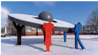
Auf der Horst