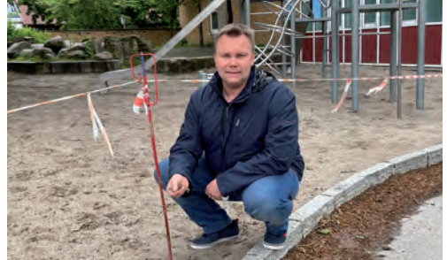
Nah an den Problemen: Gesperrter Spielplatz Osterbergschule